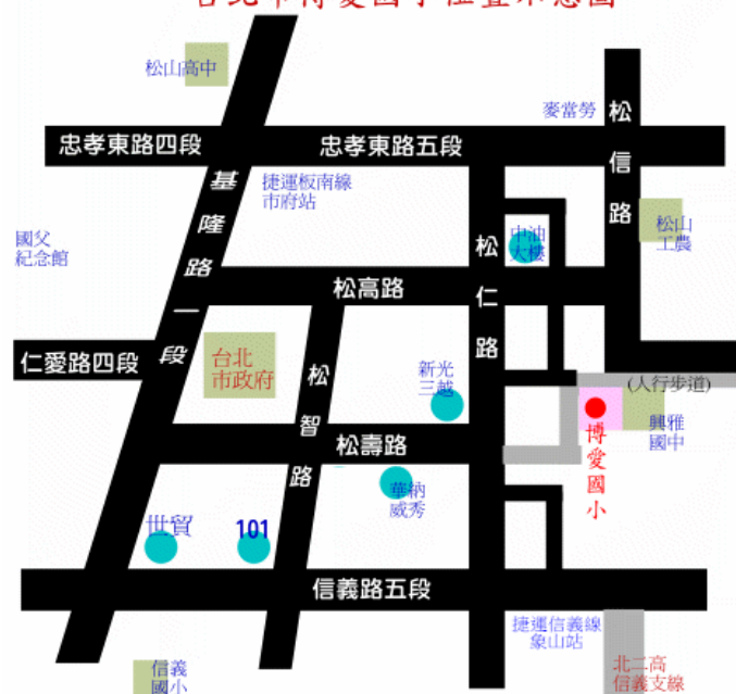
台北市博愛國小位置示意圖